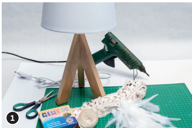
1 Disponi e prepara il nastro e le piume. Taglia il nastro a misura della circonferenza del paralume (parte alta).