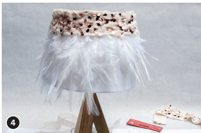
4 Fissa il nastro decorativo ai punti di colla.

Buon divertimento dal tuo team creativo OPITEC!