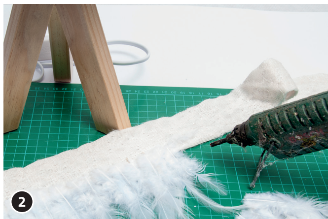
2 Con la colla a caldo fissa le piume nella parte bassa (lato interno) del nastro decorativo.